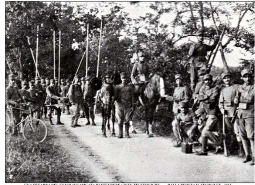
UNA SQUADRA DEL GENIO INCARICATA DI STENDERE LINEE TELEFONICHE. - DALLA RIVISTA IL SECOLO XX - 1915