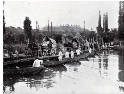
PONTE DI BARCONI COSTRUITO SULL'ISONZO DAI SOLDATI DEL GENIO. - DALLA RIVISTA IL SECOLO XX - 1915