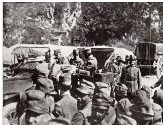
IL RE IN MEZZO AI SOLDATI. - DALLA RIVISTA IL SECOLO XX - 1915